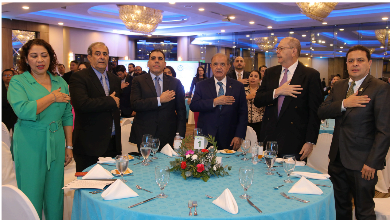
Los miembros de la Junta Directiva del CNP+LH en el solemne momento de la entonación de nuestro glorioso Himno Nacional. De izquierda a derecha: